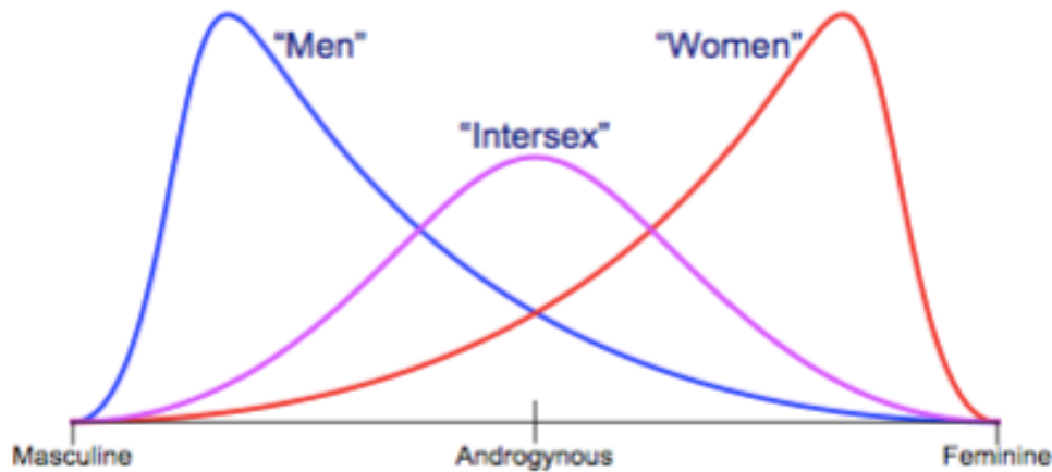
Abb. 1 verdeutlicht diese im Zitat erwähnte Vielfalt von natürlichen Unterschieden

Seit den 1990ern wird diese medizinische Praxis öffentlich kritisiert und Räume für Inter*sexuelle Menschen geschaffen. Seit 2006 gilt der Diskriminierungsschutz des Gleichbehandlungsgesetzes auch für Inter*sexuelle Menschen (Voss, 2009, p. 44). Die Anerkennung von Inter*sexuellen Körpern, obwohl diese auch eine biologische Tatsache sind, steht jedoch aus, wird tabuisiert und negiert. Alleine in Deutschland leben über 1 Mio. Inter*sexuelle Menschen (Gregor, 2014, p.233 & Voss, 2009, p. 42).